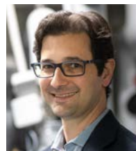
Malco Parola Energia, impianti balneari MSc ingegneria ambientale ETHZ